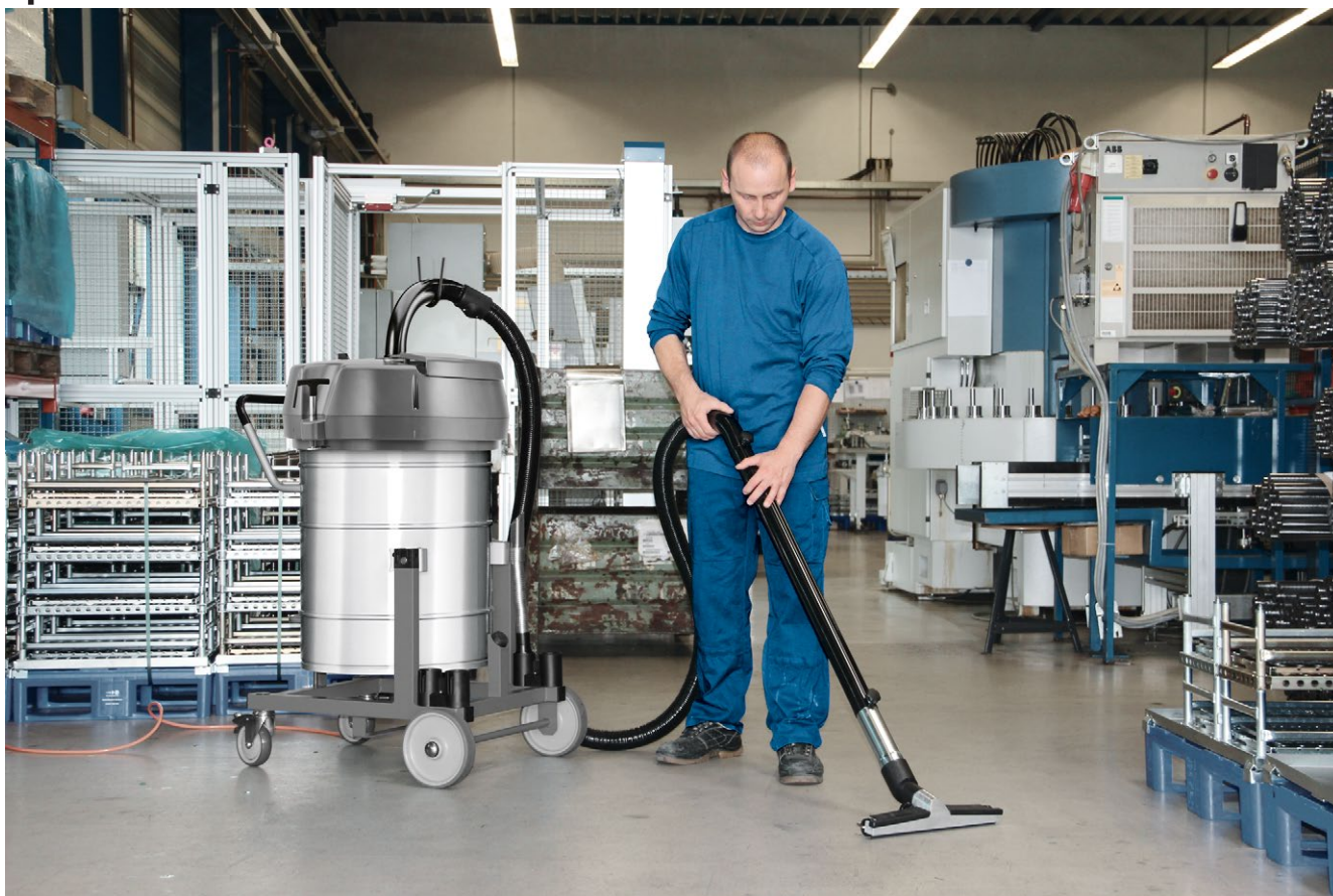
IVR-L 100/24-2 Tc Me