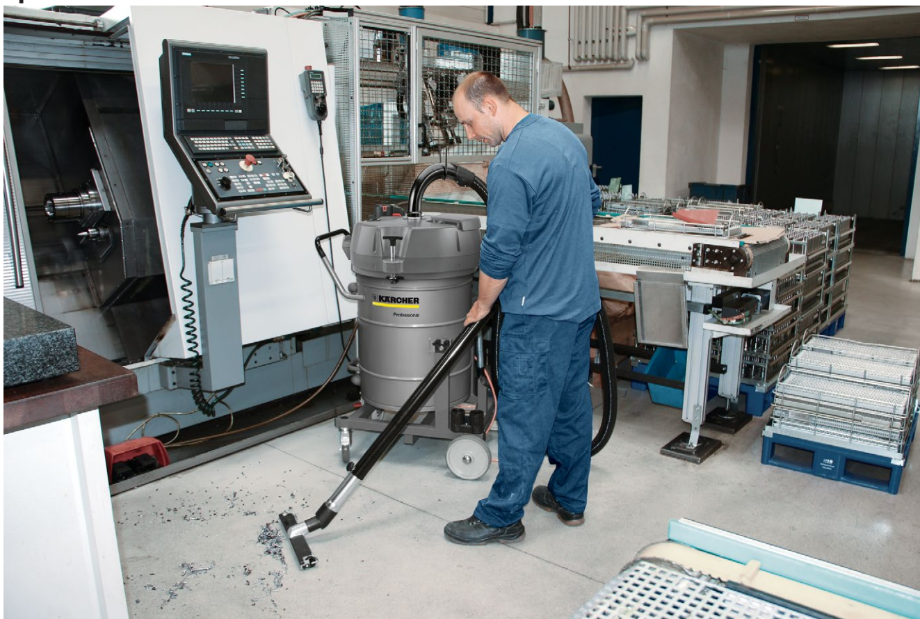
IVR-L 100/24-2 Tc